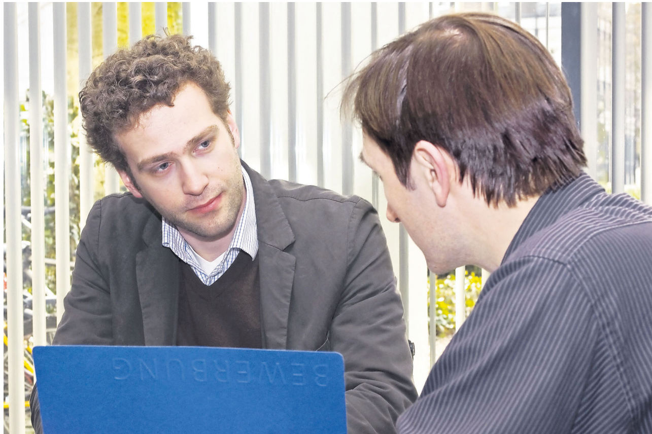
Guter Kontakt. Auf der 5. Berliner Karrierebörse können Bewerber aus dem Bereich der kaufmännischen Berufe in Beratungsgesprächen mit Vermittlern oder Weiterbildungs-trägern ihre beruflichen Perspektiven ausloten. Sekretärinnen, Buchhalter, Steuerberater und Finanzexperten werden dringend gesucht.