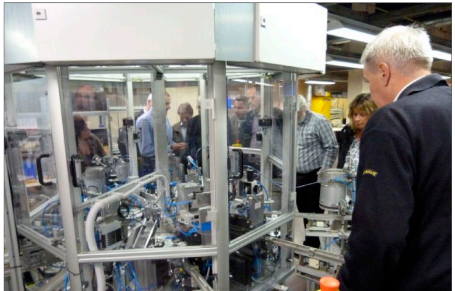
Besichtigung vor Ort: Auch 85 Jahre nach der Gründung befindet sich die Berliner EAW Relaistechnik mit ihren Hightech-Anlagen auf dem aktuellen Stand.

Noch heute agiert die EAW mit ihren Produkten auf allen Kontinenten und hat in ihrem US-amerikanischen Besitzer aus Ohio einen treuen Freund und kompetenten Begleiter gefunden, dem mittelständische Wirtschaft in den Zeiten von Globalisierung noch sehr viel bedeutet.